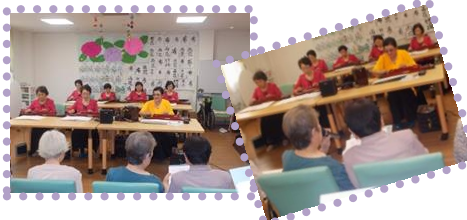
琴の音色に合わせて歌を披露