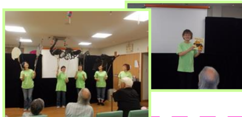
「かたあしダチョウのエルフ」初めて聞くお話に皆さん釘づけ