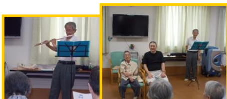
お誕生日の方にフルーツでハッピーバースデー♪