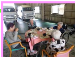
ピクニックみたいと、とても喜んで頂きました。