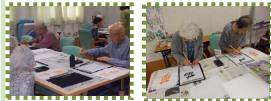
それぞれのスタイルで書き上げられました。