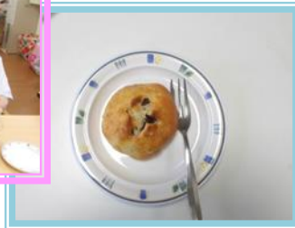
美味しく頂きました。