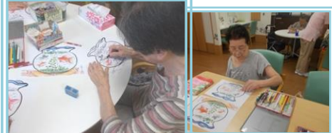
涼しげな金魚鉢を塗り、目からも涼しさを感じる事が出来ました。